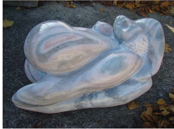
Kërmill - 54x34x30cm - Mermeri nga Sölk (Austri) - 2009