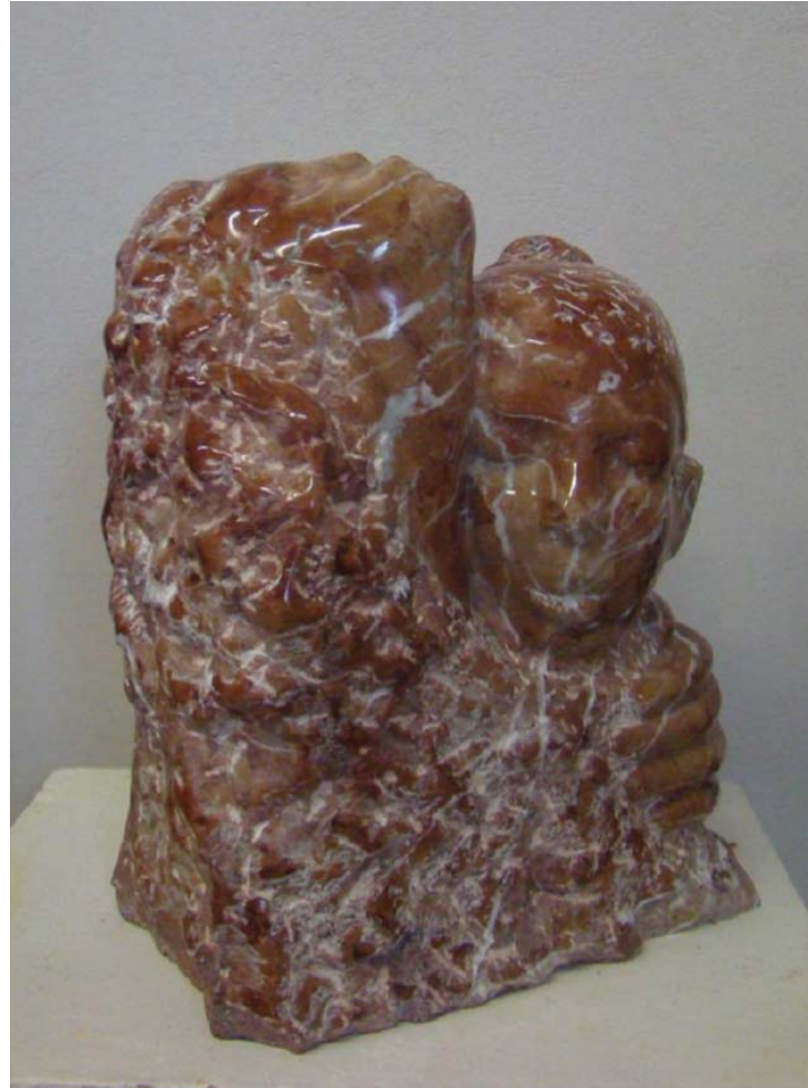
Dy Vajza - 25x17x31cm - Mermeri nga Vorarlberg - 2011