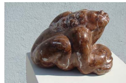
Bretkosa - 20x27x20cm - Mermer nga Arlberg (Austri) - 2013