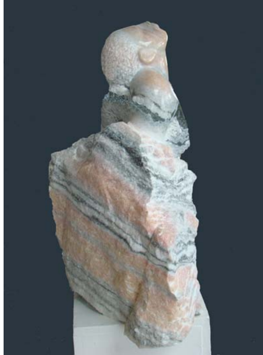
Gruaja e Hasit - 60x30x65cm - Mermer nga Gummern (Austri) - 2010