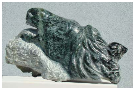
Kali i Doruntinës - 55x25x33cm - Serpentinë e egër - 2012