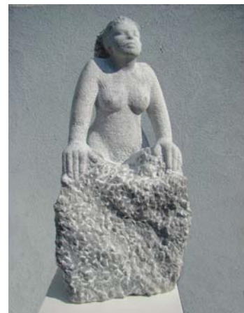
Shikuesja - 30x20x60 cm Mermer nga Wachau - 2014