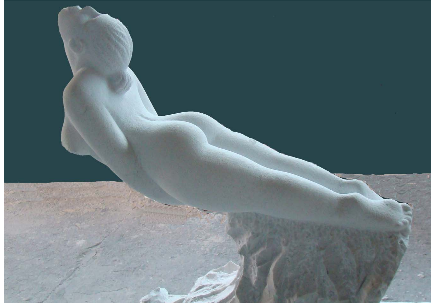
Komet - 96x35x86 cm - Mermer nga Karrara (Itali) - 2013