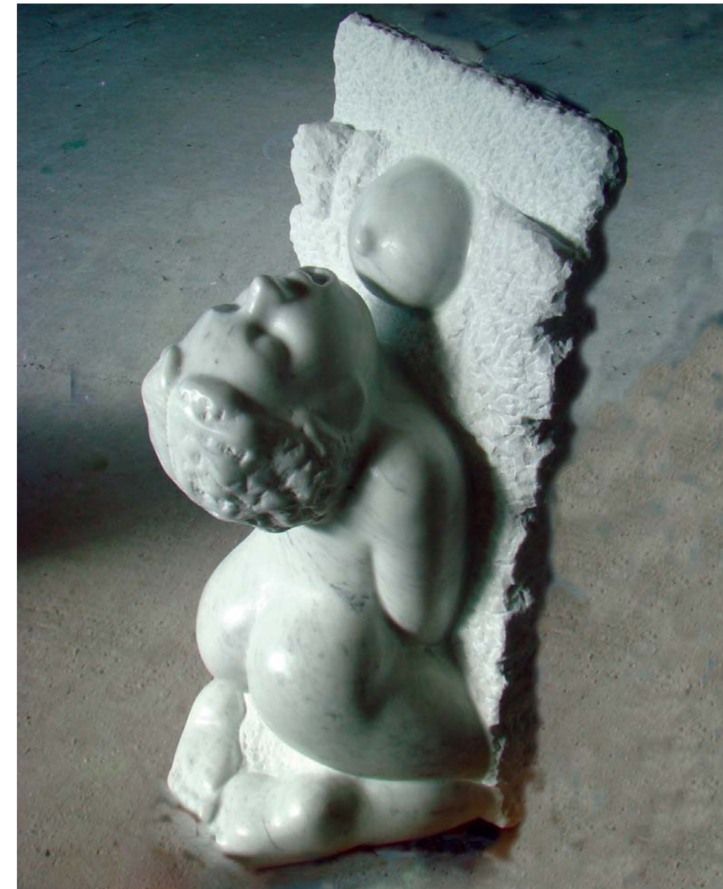
Legjenda e Rozafës - 30x26x60cm - Mermer nga Karrara - 2013