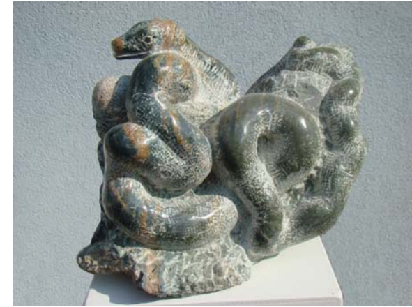
Gjarpër - 43x26x31cm - Serpentin i egër - 2014