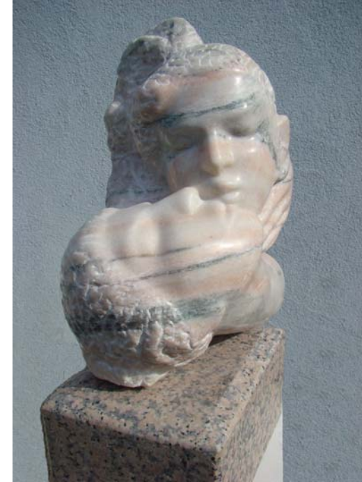
Puthje - 23x39x25cm - Mermeri nga Sölk (Austri) - 2011