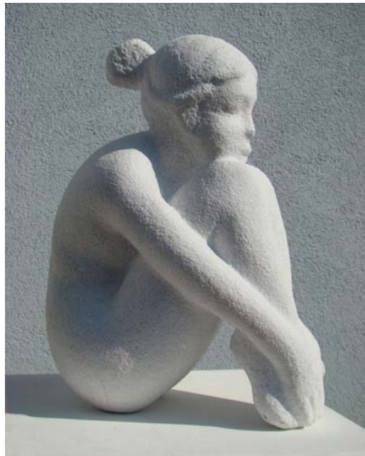
Vajza ulur - 17x25x36cm, 2011 - Mermer nga Karrara - 2011