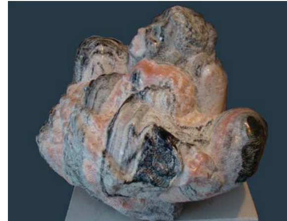
Nëna me fëmijë - 60x50x50cm - Mermer nga Gummern (Austri) - 2010