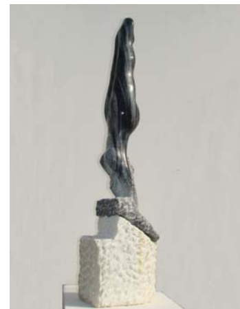
Zhytësja - 82x25x20 - Mermer nga Wachau (Austri) Basament mermer nga Sölk - 2008