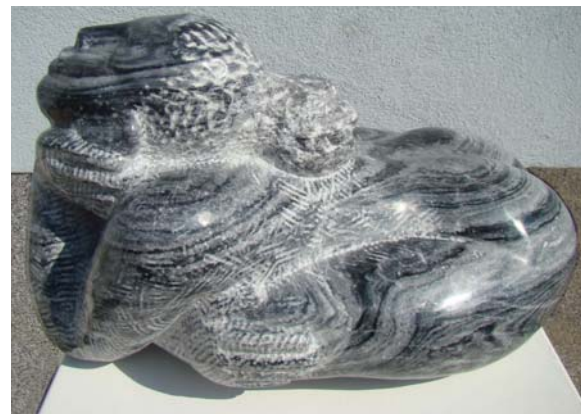
Adela - 45x35x28cm - Mermer nga Wachau (Austri) - 2013