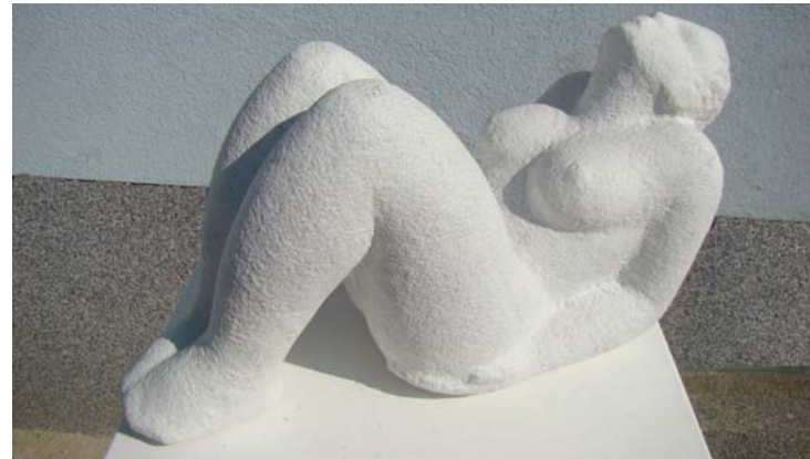
Ngrohja në diell - 16x11x28cm - Mermer nga Karrara (Itali) - 2012