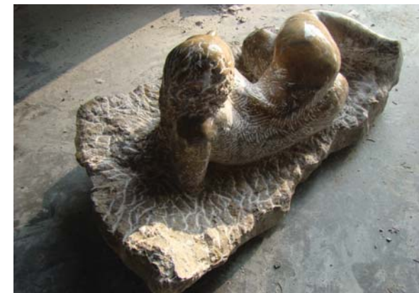
Afrikane - 64x27x33 cm - Mermer nga Salzburgu - 2007