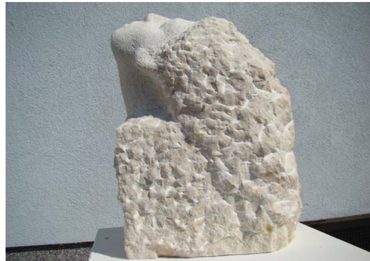
Engjell duke kënduar - 20x30x42cm - Mermer nga Austria - 2012