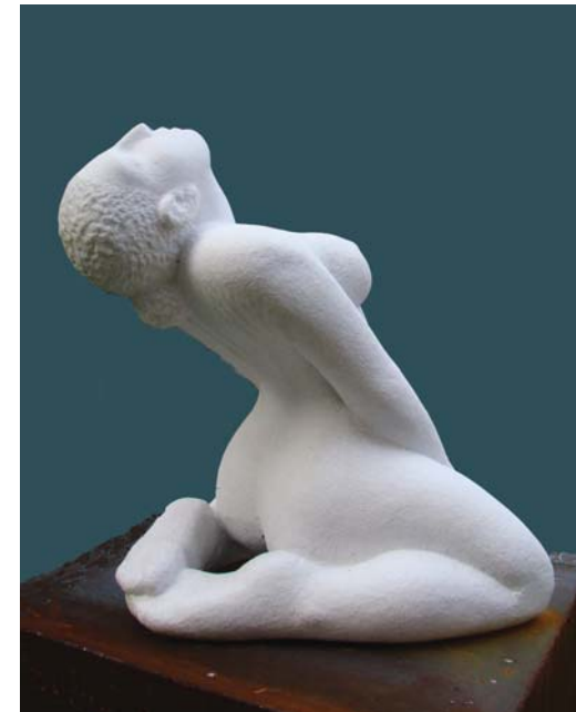
Pasion - 57x65x65cm - Mermer nga Karrara (Itali) - 2010