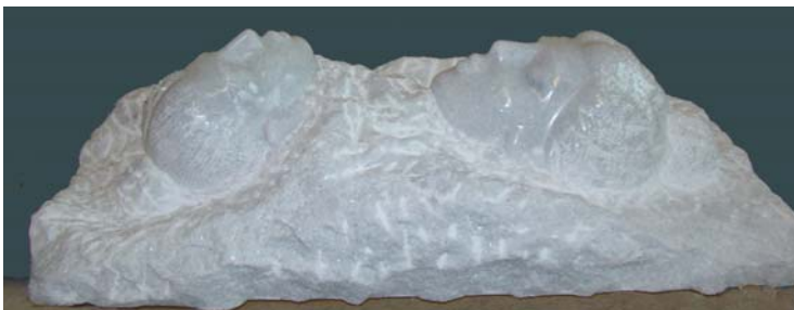
Dy vajza duke u larë në Ksamil - 80x38x30cm - Mermer (Austri) - 2013